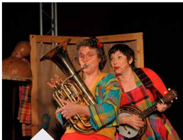
Spectacle «Zip, Zap, Wabap» du duo Combo Karib

Les musiciennes ont joué des morceaux traditionnels, donnant à voir, et à entendre une multitude de sons et de couleurs sur un répertoire musical né lui-même d'un métissage entre l'Afrique et l'Europe.