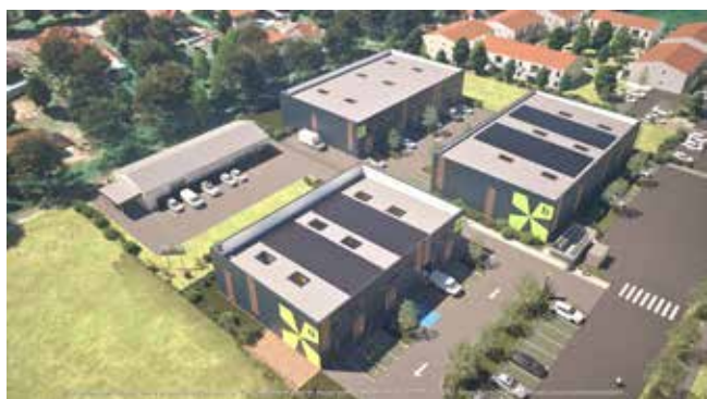
Illustrations non contractuelles, propriété de 3DPM-Studio

Après l'agrandissement d'Intermarché et le développement de la zone économique Pujeau Rabe, vous allez bientôt découvrir l'aménagement final de ce site, qui accueillera encore de nouveaux artisans et commerçants. Tous les locaux sont disponibles à la vente ou à la location. Cette dynamique permettra la création d'emplois sur place et offrira davantage de services de proximité.