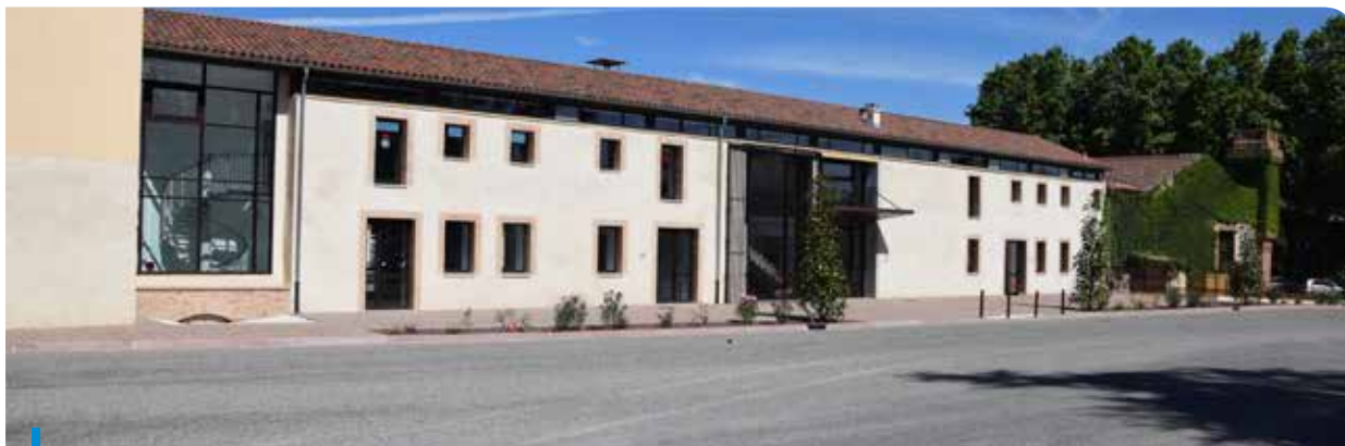
L'aile est du château

Ce même jour, nous avons inauguré l'aile est du château, dernière étape de la rénovation de ce bâtiment, construit sur un site gallo-romain.