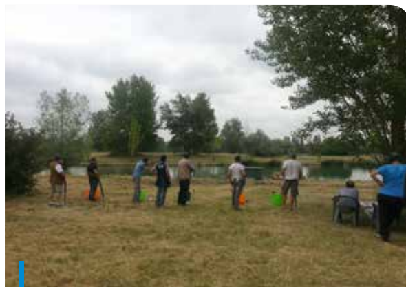
Le Ball Trap à la maison de la nature

La chasse, c'est avant tout un sport, une communion d'amour entre l'homme et son chien, c'est marcher dans les bois, les champs et sur les chemins avec de vrais amis. De plus, cette année 2014/2015, pour faire face à l'urbanisation grandissante, les villages de Lavernose et Lherm ont souhaité se rapprocher. Une AICA (association intercommunale de chasse agréée) est née le 26 avril dernier. En plus du fait d'élargir le territoire de chacun et de lever ses frontières virtuelles, c'est ensemble que nous unissons nos savoirs, nos coutumes et nos efforts dans une même entité.