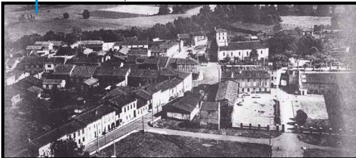
Le château de Lavernose vu depuis le cimetière

La surprise de la journée était dans la tenue de l'équipe dirigeante, qui vous a préparé une parade.