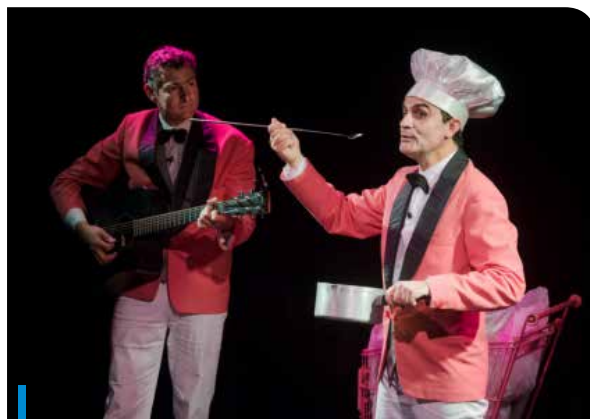
Histoires à manger