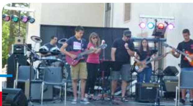
Graines de Rockeurs

Si vous avez envie de participer aux activités ou peut-être aussi vous engager dans la vie de l'association vous êtes les bienvenus.