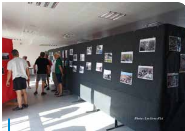
La nouvelle salle « Vernosolem »

Vous pouvez nous contacter au : 06.34.96.32.47/09.81.09.36.47 - Mme BECRET ou au 06.34.96.32.47 - Mme GALERA.