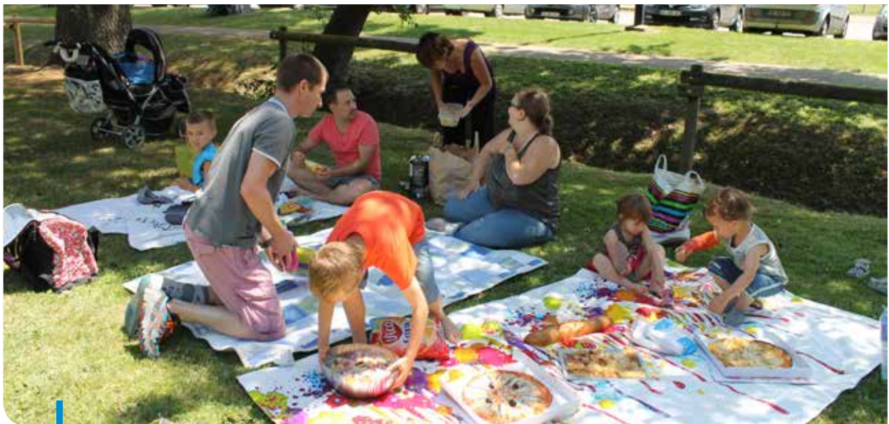
Pique-Nique entre amis de l'EVS