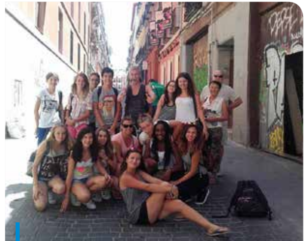
Les jeunes du PAJ visitent Madrid

Ouvert tous les mercredis après -midi, vendredi soir (17h à 19h) et vacances scolaires.