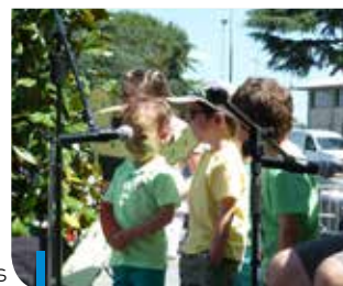
Les petits en mode «Cactus»

Nous animons aussi les ateliers d'éveil musical de tout-petits dans différentes crèches du Volvestre, pour les assistantes maternelles (RAM et associations) et les écoles. Pour cette saison 2015/2016 nous aurons un nouveau professeur de piano.