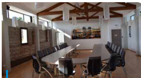
La salle du conseil municipal et des mariages