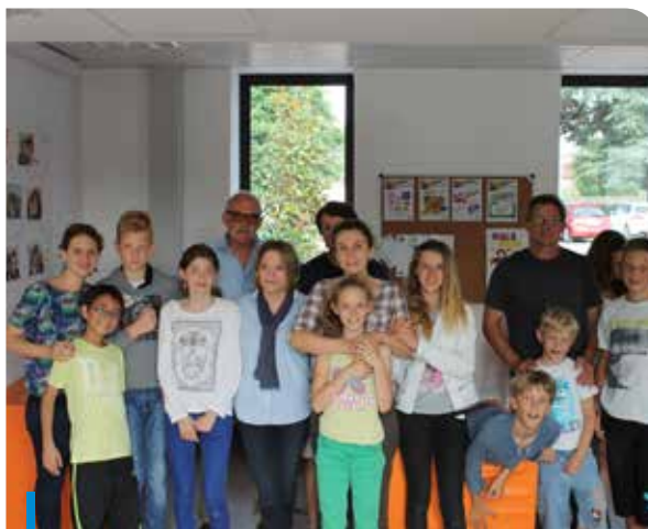
L'équipe du CLAS, les collégiens et leur famille

L'Escale, un partenariat : Mairie, Foyer Rural, Fédération des Foyers Ruraux 31/65, CAF et Conseil Départemental.