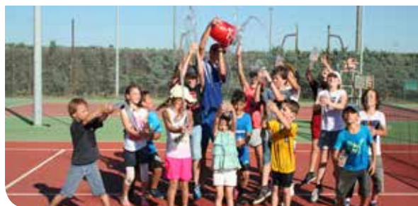
La fête de fin d'année de l'école de tennis