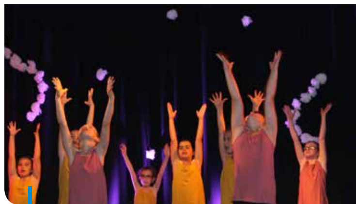
Spectacle de danse «l'éveil des sens»