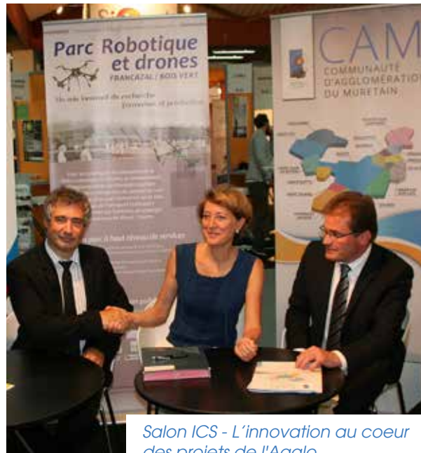
Salon ICS - L'innovation au coeur des projets de l'Agglo.

Enfin, la question des mobilités sera particulièrement étudiée, pour promouvoir les mobilités douces et développer le covoiturage et le transport collectif.