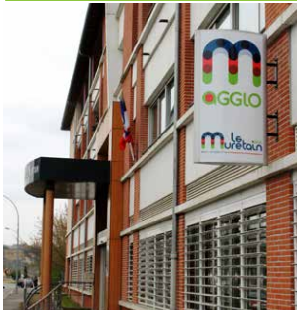
Le siège du Muretain Agglo vous accueille au 8 bis avenue V.Auriol à Muret.

L'agglomération et les communes travaillent à organiser le service au meilleur endroit au service de tous.